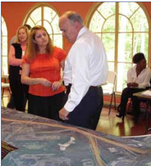
Los ciudadanos y el personal en una reunión comunitaria en los apartamentos Las Colinas.

Un aspecto importante del proceso SDEIS es la consulta y la coordinación con las partes potencialmente afectadas por el proyecto. Durante la preparación de la DEIS, GDOT y el equipo del proyecto dedicaron esfuerzos especiales para recabar opiniones de numerosos grupos de electores. En el futuro, seguiremos con estas iniciativas mientras nos esforzamos por comunicar los cambios al proyecto y recabar opiniones.